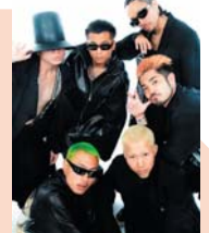
KING OF SWAG